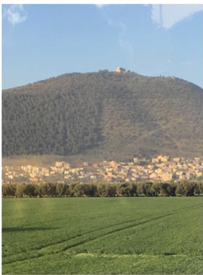
Monte Tabor (Mateo 17:1-9) (Marcos 9:2-8) (Lucas 9:28-36)

buscar estos pasajes, los niños pueden leer sobre los eventos que ocurrieron en Caná y otros lugares directamente de la Palabra de Dios.