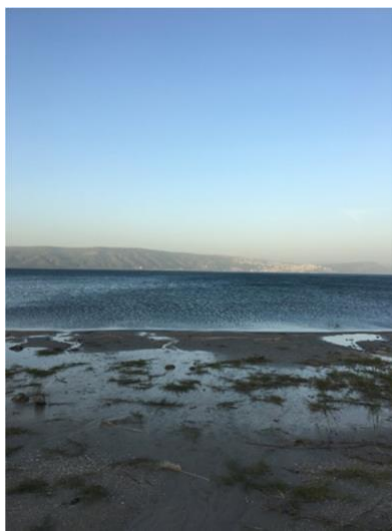
El Mar de Galilea (Mateo 4:12-22) (Marcos 4:35-41) (Juan 21:1-14)